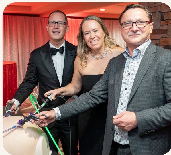
外科醫生展示未來手術器械

展望將來，Yurkovich家族大樓將擴大服務、提高效率、提升護理服務，為列治文的病人與家庭提供更好的醫療護理。