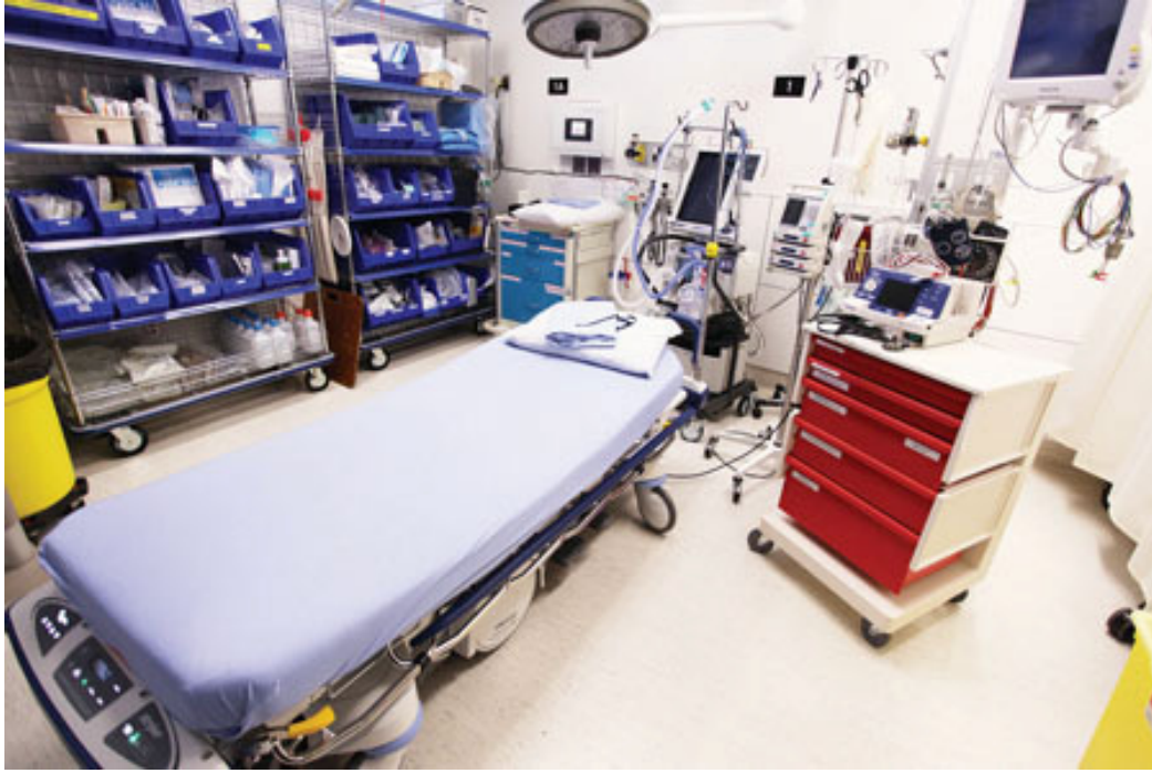
翻新後的急症室增添了各類設備、區域規劃也更為完善。